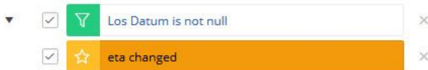
Filters uitgeklapt 1

Bent u klaar met het maken van uw eigen layout? Sla deze dan op als 'privé rapport'.